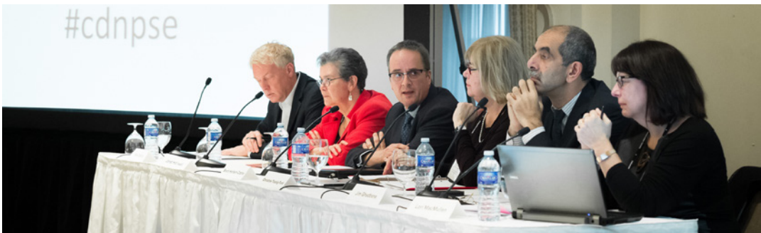
Un groupe d'expert se penche sur l'écosystème de l'infrastructure de recherche numérique du Canada